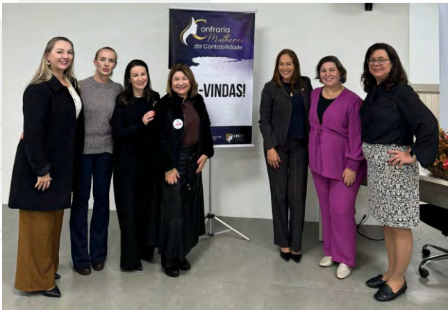
Confraria Mulheres da Contabilidade fortalece a presença feminina.

No ano passado o Conselho Regional de Contabilidade de Santa Catarina (CRCSC) lançou o projeto Confraria Mulheres da Contabilidade. O projeto busca promover um ambiente favorável para mulheres contadoras que atuam na mesma região, com o objetivo de incentivar a troca de experiências, o networking e a conexão.