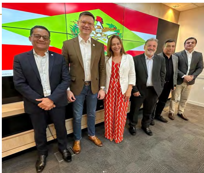
CRCSC e entidades contábeis em reuniões com a Sefaz.