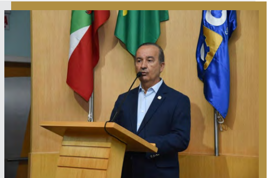
Governador do Estado de Santa Catarina, Jorginho Mello

da inteligência e da credibilidade de vocês, para que esses fundos sejam superavitários para que possamos atender mais projetos. Pois temos uma grande responsabilidade em atender estes grupos mais vulneráveis, como as crianças e os idosos”, declarou o governador.